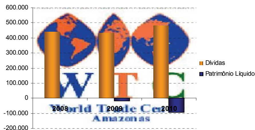
Gráfico: Composição da Dívida (Valores em R$ mil)

Por ser uma empresa em estágio pré-operacional não diferiu números significativos que merecessem qualquer comentário especial.